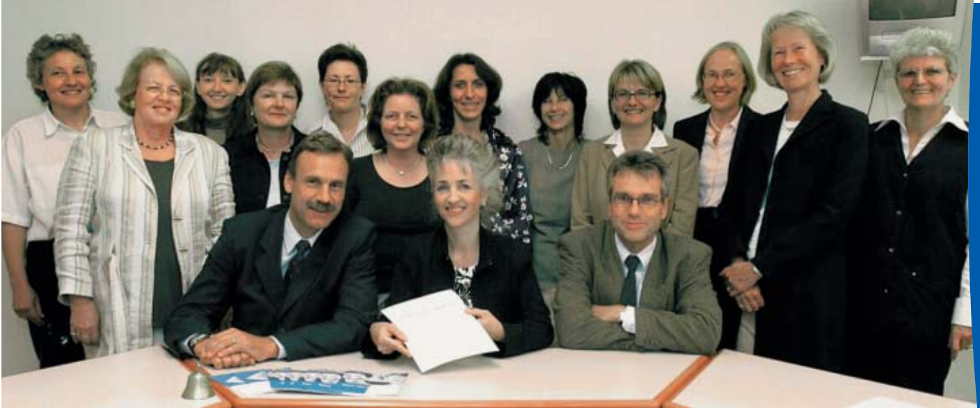
Remise du certificat pour l'excellence dans le management sur la base du label NPO

Il y a tout juste deux ans, les femmes PRD de la ville de Zurich ont été le premier parti politique de Suisse à se faire certifier sur la base du label NPO pour l'excellence dans le management. Ce label a été développé en collaboration avec l'Institut pour le management des associations (VMI) de l'Université de Fribourg et l'Association Suisse pour Systèmes de Qualité et de Management (SQS). Voici un premier bilan des expériences faites.